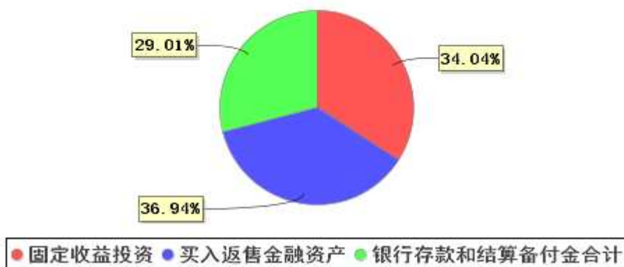
投资组合资产配置图表(2023年6月30日)