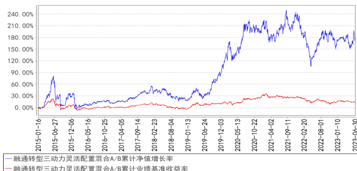
融通转型三动力灵活配置混合A/B累计净值增长率与同期业绩比较基准收益率的历史走势对比图