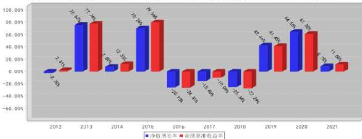
融通创业板指数A/B基金每年净值增长率与同期业绩比较基准收益率的对比图(2021年12月31日)