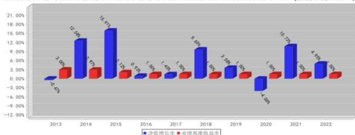
融通岁岁添利定期开放债券B基金每年净值增长率与同期业绩比较基准收益率的对比图(2022年12月31日)