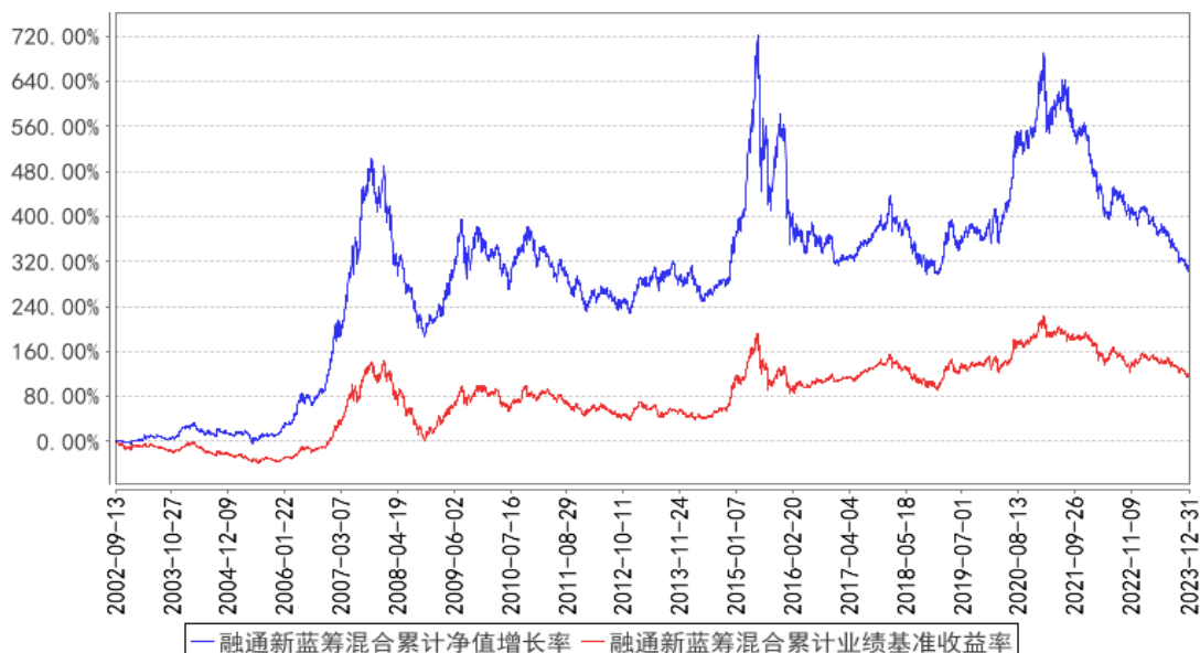
融通新蓝筹混合累计净值增长率与同期业绩比较基准收益率的历史走势对比图

注：上图中基金业绩比较基准项目分段计算，其中 2009 年 12 月 31 日之前（含此日）采用“国泰君安指数×75%+银行间债券综合指数×25%”，2010 年 1 月 1 日至 2015 年 9 月 30 日期间采用“沪深 300 指数收益率×75%+中信标普全债指数收益率×25%”，2015 年 10 月 1 日起使用新基准即“沪深 300 指数收益率×75%+中债综合全价（总值）指数收益率×25%”。