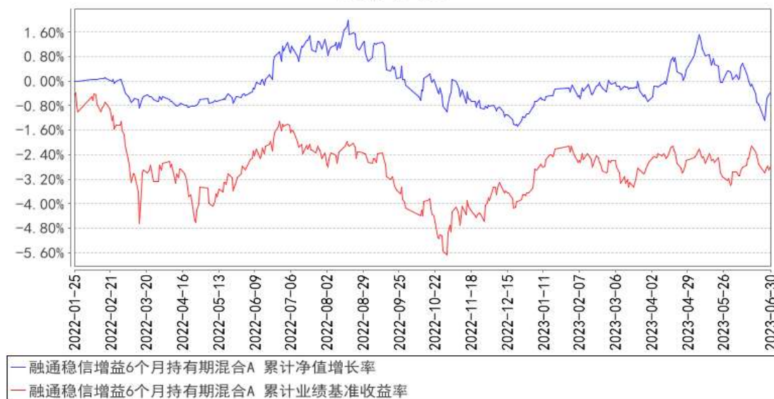
融通稳信增益6个月持有期混合A 累计净值增长率与同期业绩比较基准收益率的历史走势对比图