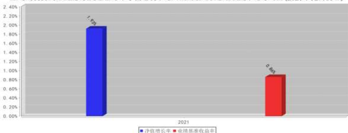
融通成长30灵活配置混合C基金每年净值增长率与同期业绩比较基准收益率的对比图(2021年12月31日)