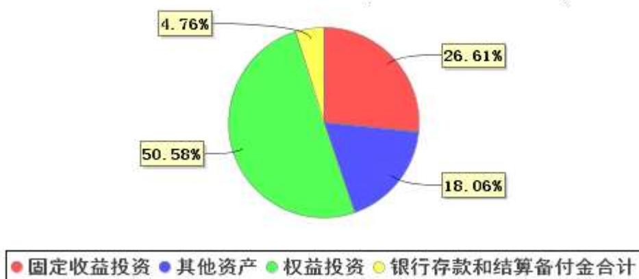
投资组合资产配置图表(2023年6月30日)

注：截至 2023 年 6 月 30 日，买入返售金融资产占基金总资产的比例为-0.01%。