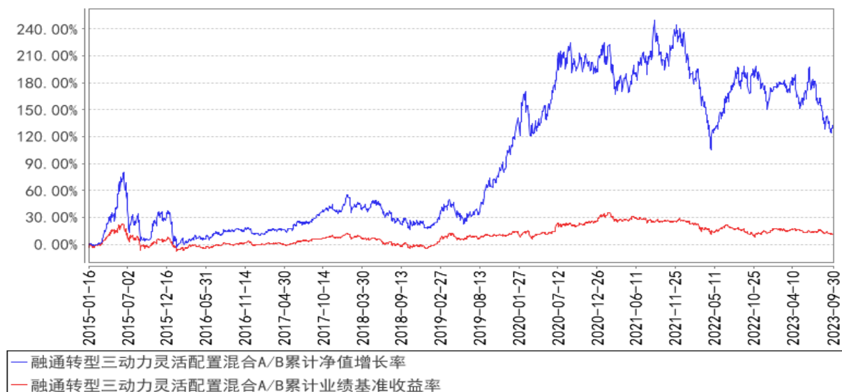
融通转型三动力灵活配置混合A/B累计净值增长率与同期业绩比较基准收益率的历史走势对比图