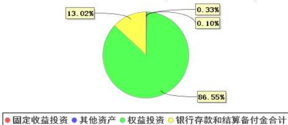
投资组合资产配置图表(2023年9月30日)