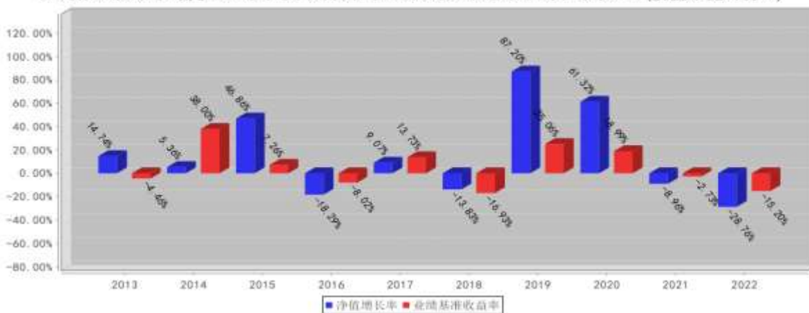
融通行业景气混合A/B基金每年净值增长率与同期业绩比较基准收益率的对比图(2022年12月31日)