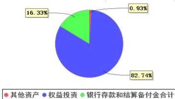
投资组合资产配置图表 (2023年9月30日)