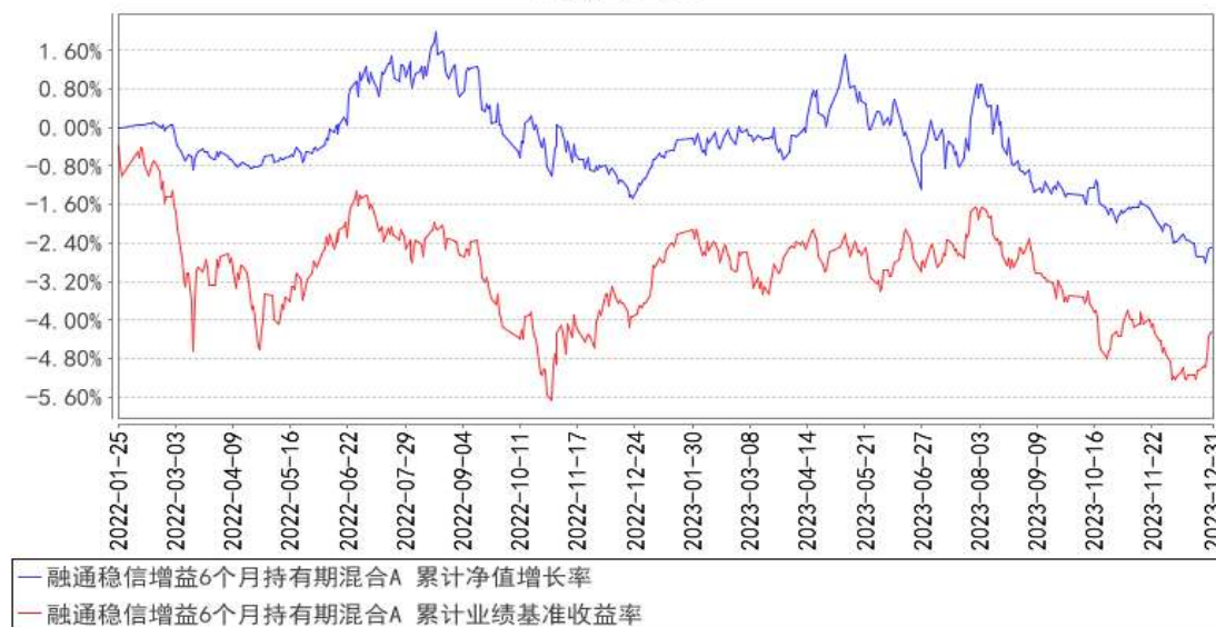
融通稳信增益6个月持有期混合A 累计净值增长率与同期业绩比较基准收益率的历史走势对比图